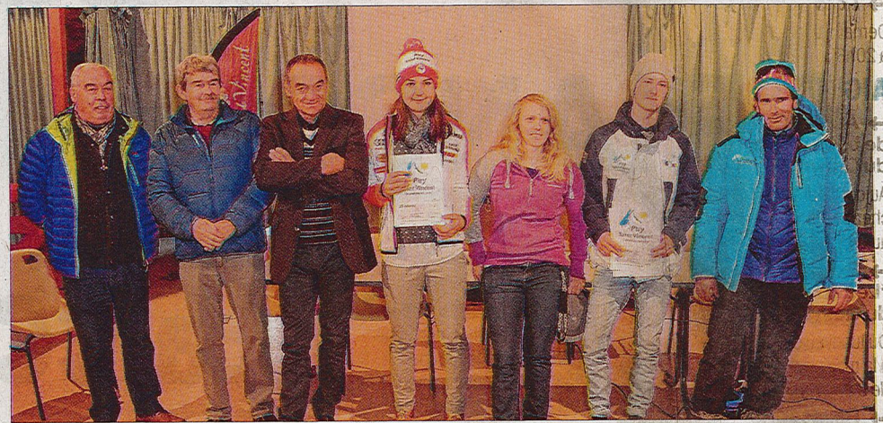
C'était Noël pour les jeunes sportifs prometteurs de la station. Cette aide leur permettra d'assumer une partie des coûts de la pratique du sport en haut niveau.