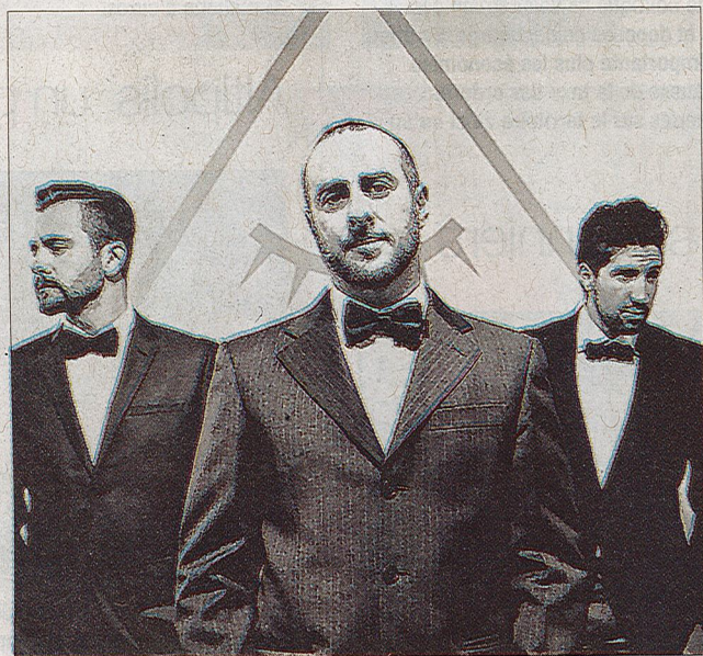
Le groupe Consortium organise son propre réveillon, le 31 décembre.

Le groupe briançonnais, chouchou du public, organise cette année son propre réveillon du 31 décembre. Habituellement appelé par les bars et centres de vacances pour animer leurs soirées, le trio, en pleine expansion, a décidé de créer l'événement, à l'occasion du passage à l'an 2016.